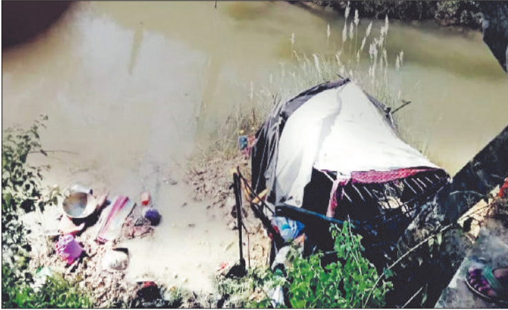
नाले में घुसा आटो।