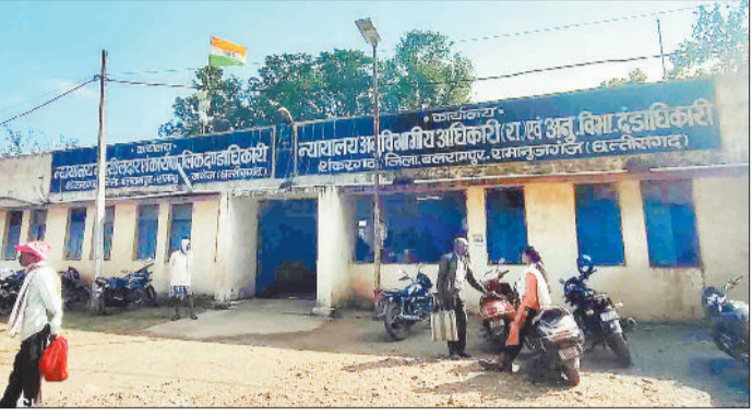
तहसील कार्यालय के सामने मौजूद किसान।

लेकिन पंजीयन और गिरदावरी में लापरवाही के कारण कई किसानों की मेहनत की फसल मंडी तक पहुंचना मुश्किल हो गया है। किसानों का आरोप है