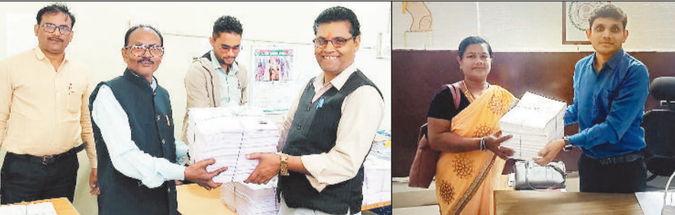
अभियान की शुरुआत करते अधिकारी।