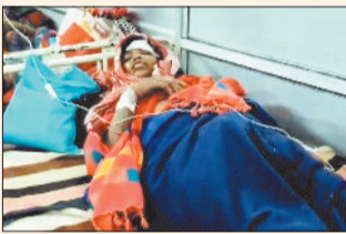
अस्पताल में भर्ती घायल।